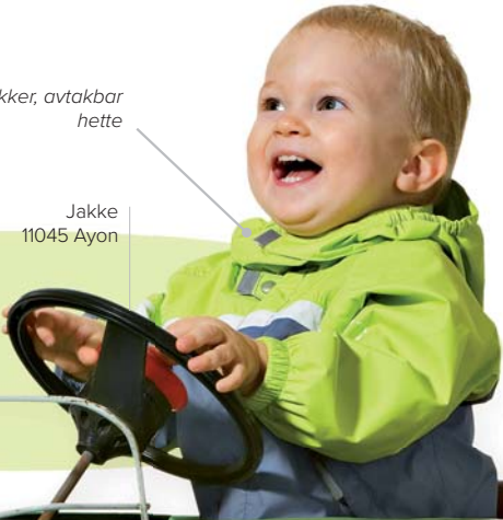
Jakke 11045 Ayon