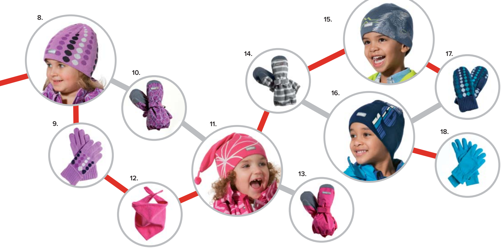
1. fleeevotter 14209 Eigg, 2. babyfottøy 14220 Baffin, 3. lue 14216 Marmara, 4. votter 14221 Buru, 5. lue 14213 Creighton, 6. babyfottøy 14208 Efisio, 7. lue 14219 Belize, 8. lue 24353 Seychelles, 9. strikkevotter 24356 Tiara, 10. votter 24368 Adney, 11. lue 24364 Wight, 12. halsvarmer 24324 Mussalo, 13. votter 24369 Delius, 14. votter 24367 Fyn, 15. lue 24362 Colt, 16. lue 24361 Ajos, 17. strikkevotter 24355 Taisie, 18. fleeehansker 24325 Lyokki