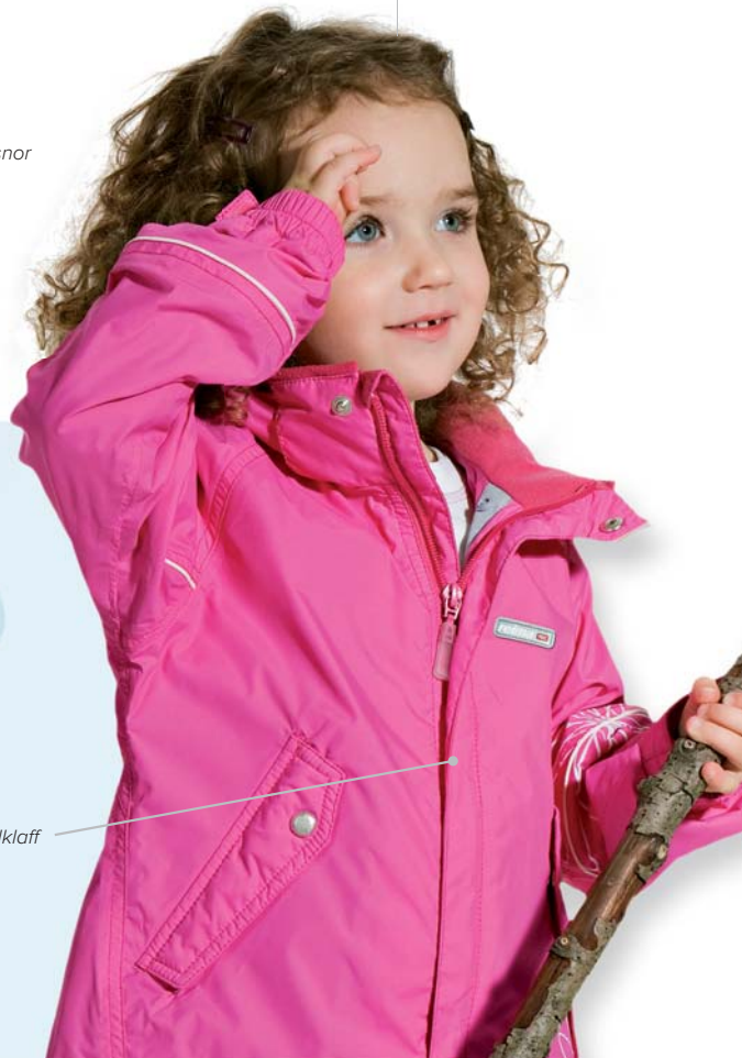
Jakke 21268 Austra