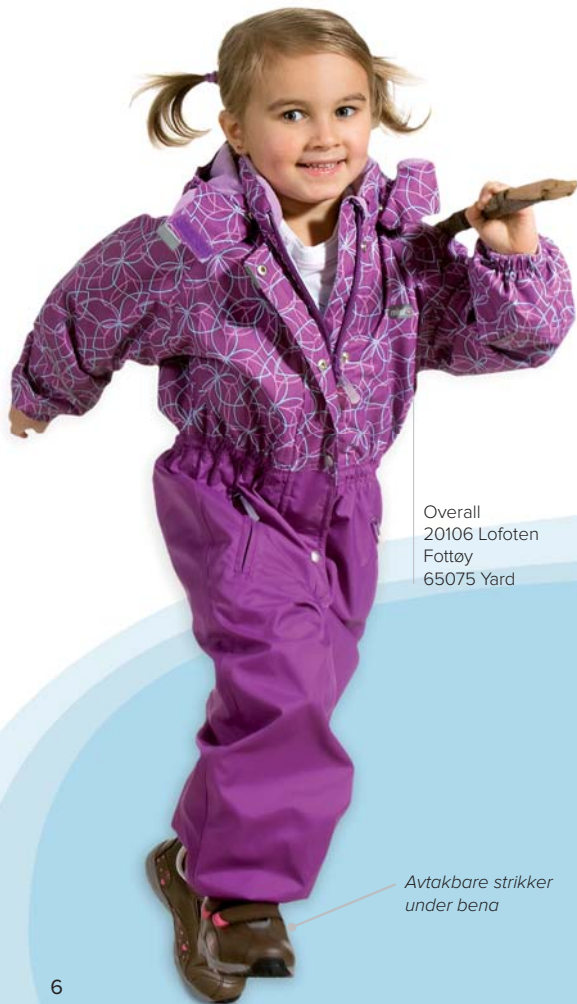
Overall 20106 Lofoten Fottøy 65075 Yard